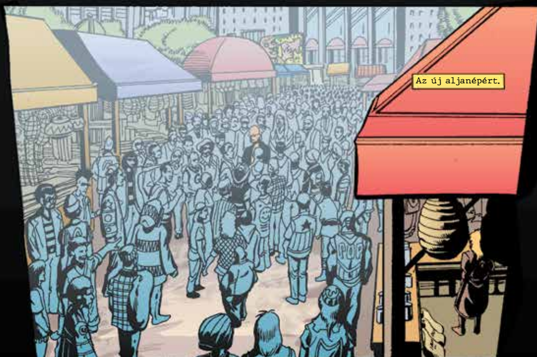
Az új aljanéperért.